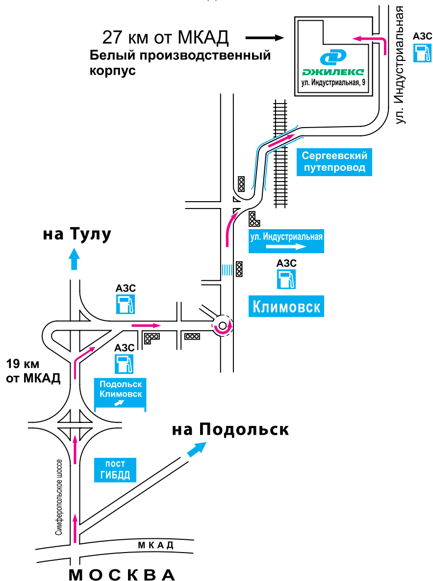
СХЕМА ПРОЕЗДА ОТ МОСКВЫ